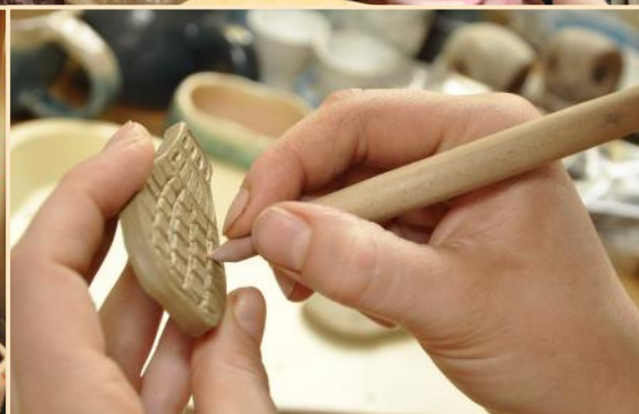
Mirek po práci Agáta ve svém království